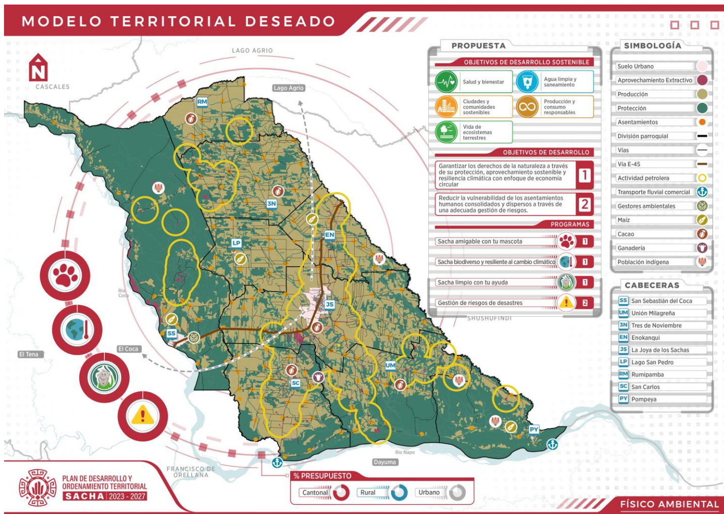
Gráfico 9. Modelo territorial deseado - Sistema Físico Ambiental