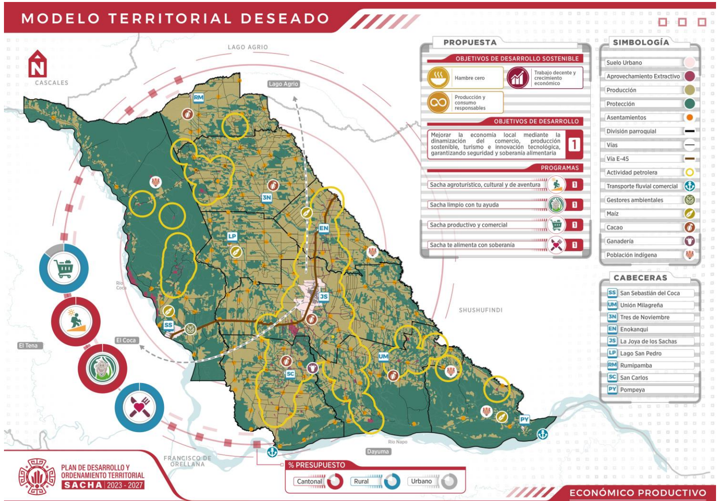
Gráfico 8. Modelo territorial deseado - Sistema Económico productivo