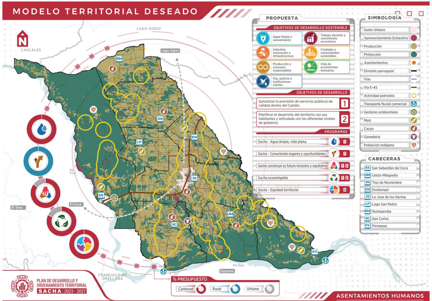
Gráfico 6. Modelo territorial deseado - Sistema Asentamientos Humanos