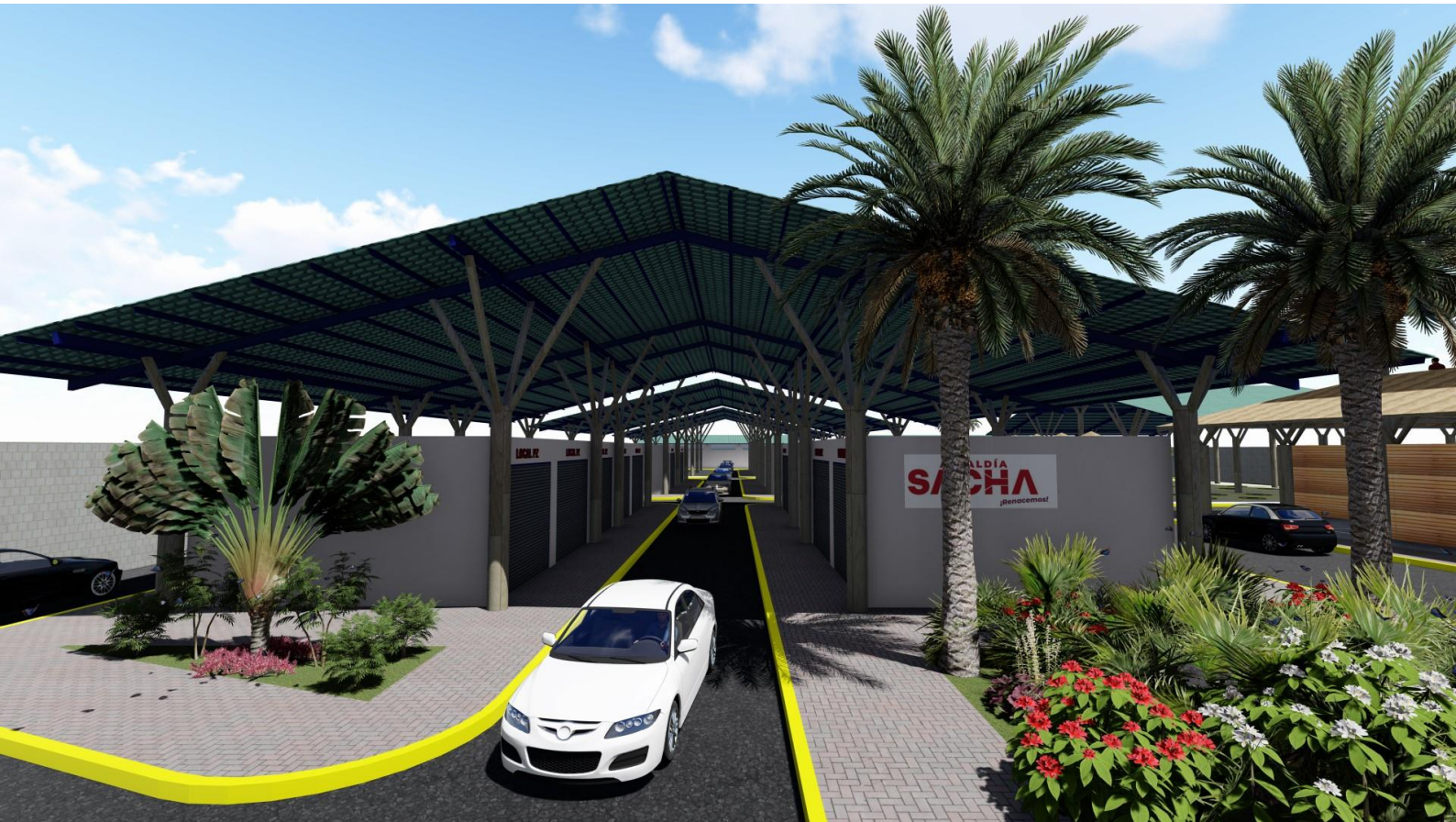
Gráfico 4. Construcción de feria de comercialización productores de la zona y gastronómica de nacionalidades