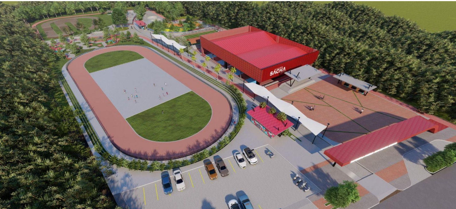
Gráfico 3. Parque de la familia