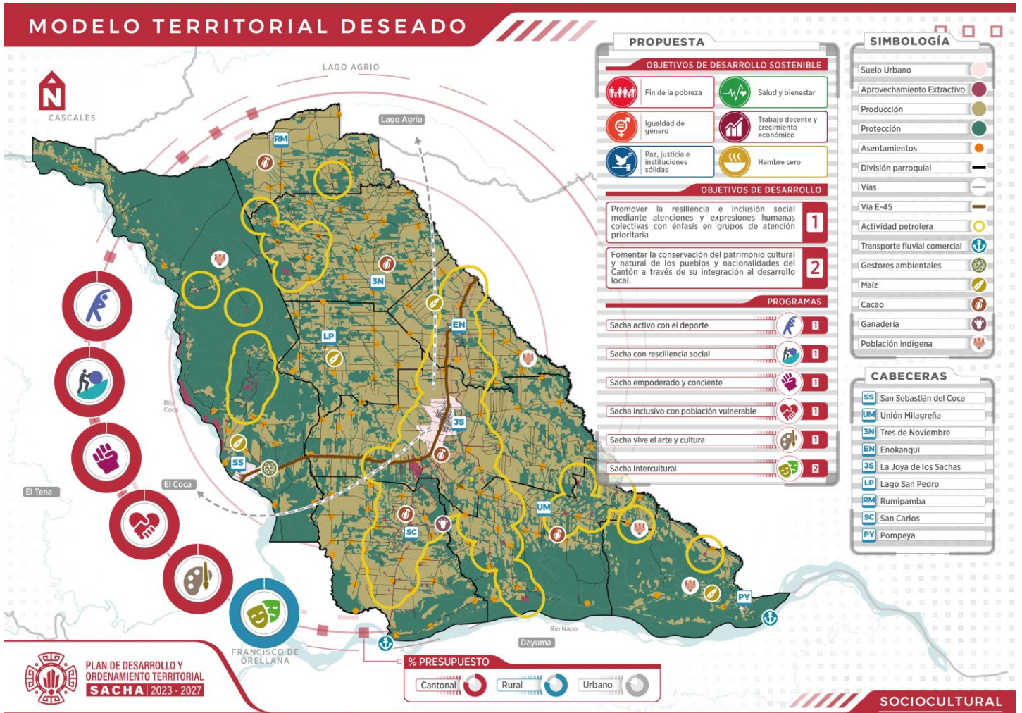
Gráfico 7. Modelo territorial deseado - Sistema Sociocultural