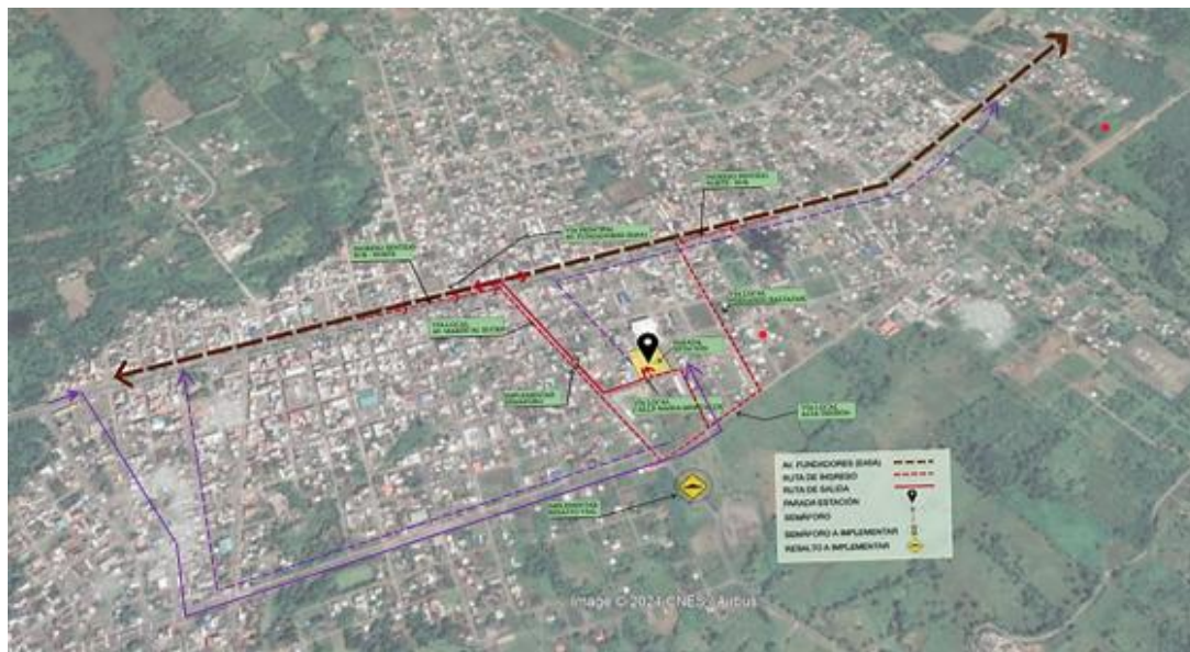
Ilustración N° 2 Gráfico de rutas.

Artículo 60. Excepciones a la obligatoriedad de ingreso a la Parada de Embarque y Desembarque de Pasajeros. - Se exceptúan de la obligación de ingresar a la Parada de Embarque y Desembarque de Pasajeros del cantón La Joya de los Sachas, los vehículos de transporte terrestre que cumplan con alguna de las siguientes condiciones: